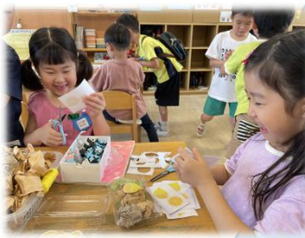
↑唐揚げにトッピングするレモンを切っています!