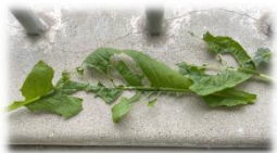
↑葉脈を残してきれいに食べられた小松菜

クラスの前で育てていたきゅうり。その日のお当番さんや気が付いた子が毎日水やりをし過ぎていたのですが...2つの苗のうちの1つの元気が、日に日に無くなっていきました。「なんか枯れてる!」と気付いた子どもたち。じっくり観察すると、土に白いカビ(?)のようなものを発見しました。用務の方にも相談すると、「もしかしたら土の中にカビがいて、きゅうりの苗に移り、病気になってしまったのかもしれない」とのこと。自分たちで育てたものが、いきいきと大きくなる喜びを感じる経験も1つですが、今回、枯れてしまったことで、食べ物を無駄にせず大切に考える気持ちや、野菜にも命があることに気付くきっかけになったように思いました。