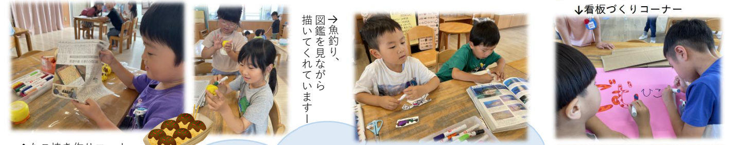
↑たこ焼き作りコーナー