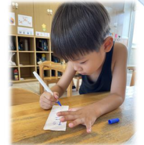
↑レシートが必要だと、ひらがなを描くことに挑戦する姿もあります。

七夕祭りの実現に向けて、話し合いが進み、①唐揚げ②たこ焼き③魚釣り④お菓子すくい⑤ゴム飛行機⑥1円玉落とし⑦かき氷をすることに決まりました。(かき氷機は保護者の方のご協力があり10台近くお借りできました...本当にありがとうございます...!)七夕の飾りを作ったり、たこ焼きを作ったり、毎日制作、制作の日々。皆よく、継続して毎日できるなあと担任が感心するほど、色々な子が入れ替わり、立ち替わりで作ることを楽しんでくれていました。「レシートもいる!」「看板もやな!」とイメージも膨らませる子どもたち。制作がひと段落したところで、誰がどのお店屋さんをするかの係決めも行いました。1人ひとりがそれぞれのお店に期待を持っていたからか、均等に分かれていたのですが、若干の偏りもありました。そんな時も「じゃあこっちいく!」と譲り合う事が出来るこひつじ1組さんに成長を感じました。。7月は七夕祭りにデイキャンプと楽しみなことが盛り沢山!体調に気を付けてお過ごしください...!